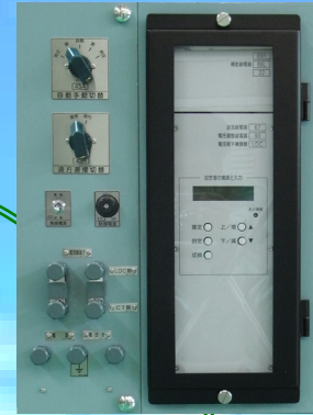
通信機能付 SVC 制御装置