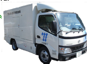
低圧発電機車 75kVA, 100kVA 高圧発電機車 300kVA, 500kVA