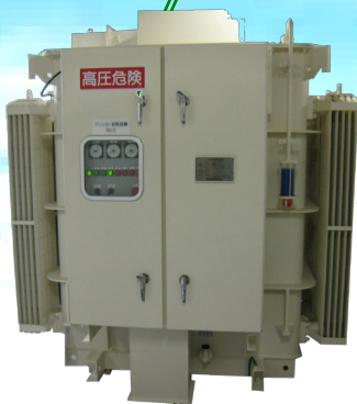
フリッカ補償装置 +600kvar, +850kvar