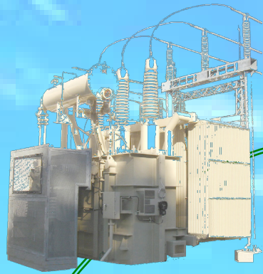
負荷時タップ切替器付変圧器