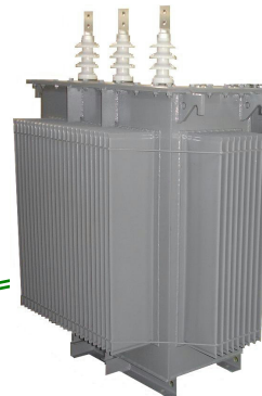
リアクトル 150, 300, 450kVA